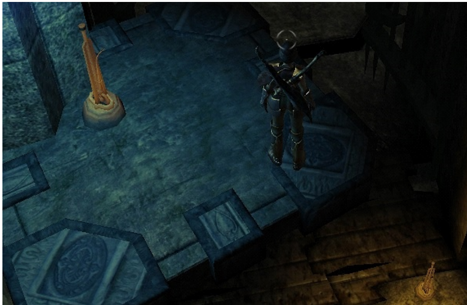
un levier en hauteur (au dessus du 2nd) ouvre une 3ème énorme porte

l'accès par l'Est et le pont associé est bloqué par une énorme porte ... il faut passer par les échelles pour monter sur le pont Ouest en partie dévasté -> Sanctuaire de la citadelle / un levier en hauteur ouvre une 1ère énorme porte / un levier au sol ouvre une 2nde énorme porte (celle qui était bloquée et qui permet d'emprunter le pont Est)