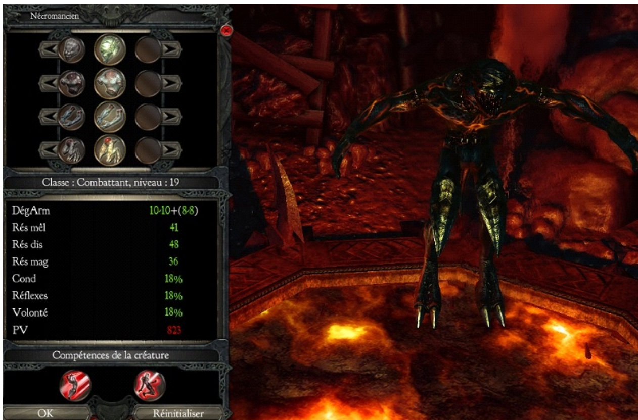
ma 1ère Créature ...

pour appeler sa Créature ou la renvoyer -> utiliser son Crâne de Cristal depuis le sac à dos