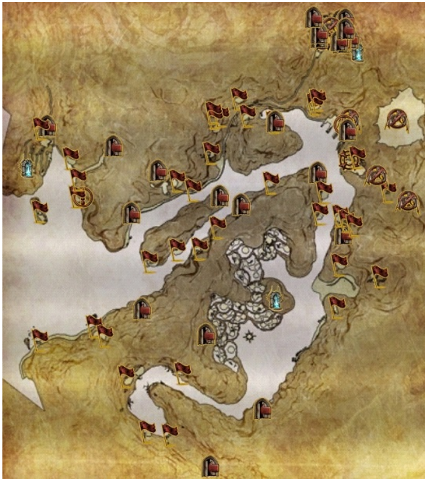
la carte des Fjords d'Orobas ...