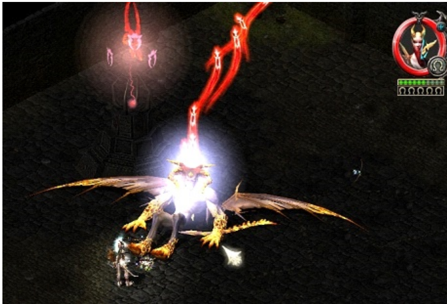
Llith'Bah, le démon de Sakkara