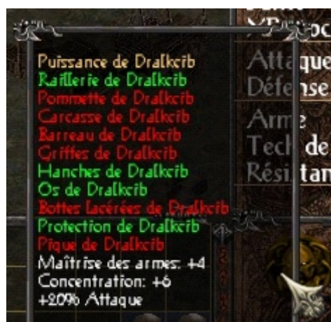
un des set d'armure Démon

pour les combos, soyez intuitif et faites des essais -> n'oubliez pas de les faire évoluer lorsqu'une des techniques concernée a augmentée de niveau